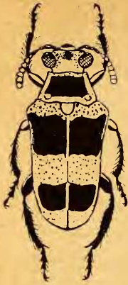
Fig. 3: Mastostethus bifasciatus n. sp.

latéraux et une grande tache noire, en trapèze occupant presque tout le disque. Ecusson ponctué, de la couleur de la tête. Elytres courts, leur ponctuation superficielle et espacée, de la couleur du corps, traversés par deux larges bandes noires, un peu déchirées sur leurs bords et n'atteignant pas la marge latérale; la première en proximité de la base, la seconde subapicale.